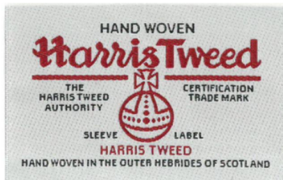
通用标签A (60 x 35mm)