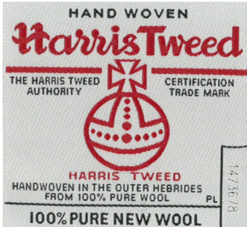
标准标签 (80 x 80mm)