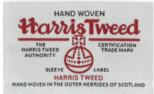
袖子标签 (80 x 55mm)