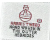
配件标签 (28 x 25)