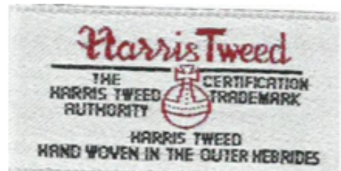
通用标签B (50 x 25mm)